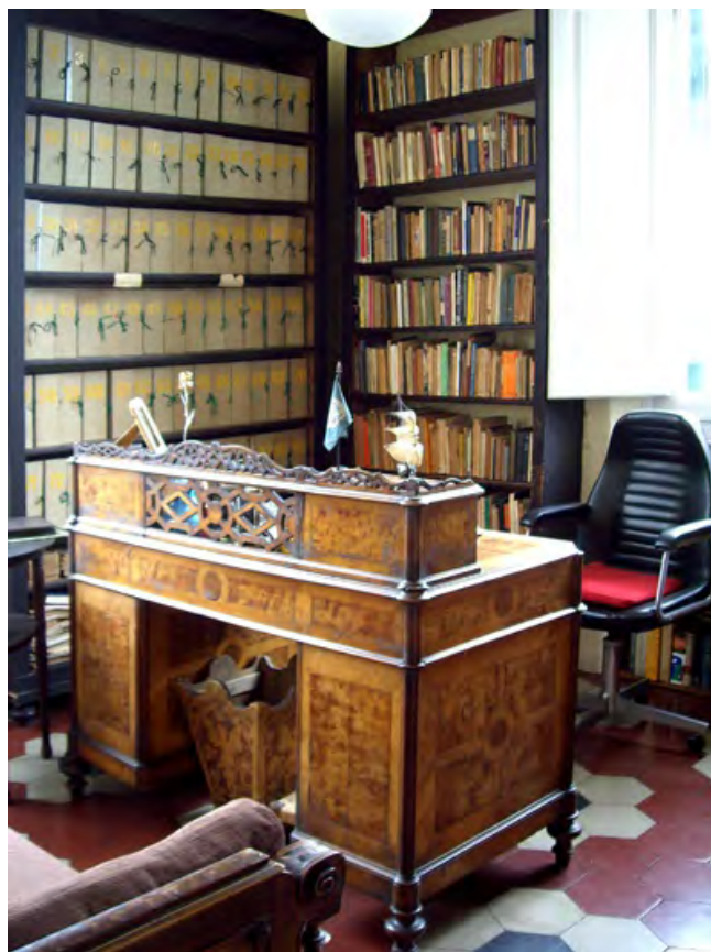
Lo studio di Roberto Assagioli

Mi colpì molto anche il suo atteggiamento nei confronti della sua religione d'origine, l'ebraismo. Io non credo che lui sia stato un grande frequentatore, un