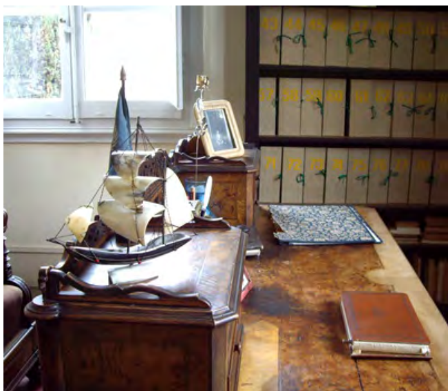
Lo studio di Roberto Assagioli

esperienza, anche per la fiducia che mi diedero di farmi lavorare in quella particolare stanza così carica di ricordi.